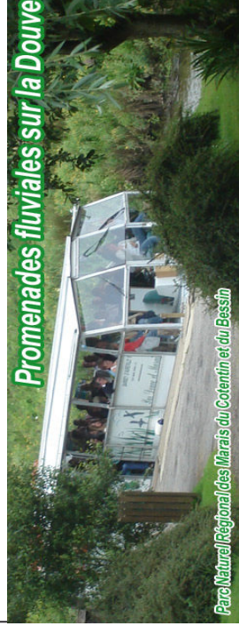
Parc Naturel Régional des Marais du Cotentin et du Bessin

Tarifs: 1 Adulte 20€ 1 Adulte + 1 enfant 25€